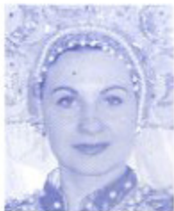
イワニコワ・アンナ (ソプラノ)

芸大を卒業後、ハバロフスクを拠点にハバロフスクオペレッタ劇場で活躍。現在、劇場の支配人であり劇団の責任者。ロシア名誉芸術賞の受賞者。来日公演も10年を経過。ベテラン歌手として活躍している。