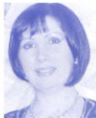
トレチャコワ・エレナ (ソプラノ)

芸大声学科を卒業後、ウラジオストックのアンサンブル“ファンタジア”にソリストとして参加。その後ハバロフスクのオペレッタ劇場に移籍。来日公演も10年、人一倍熱いおもいを寄せている。